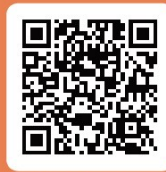
အသေးစိတ်ကြောင်းကို စကင်နိုင်