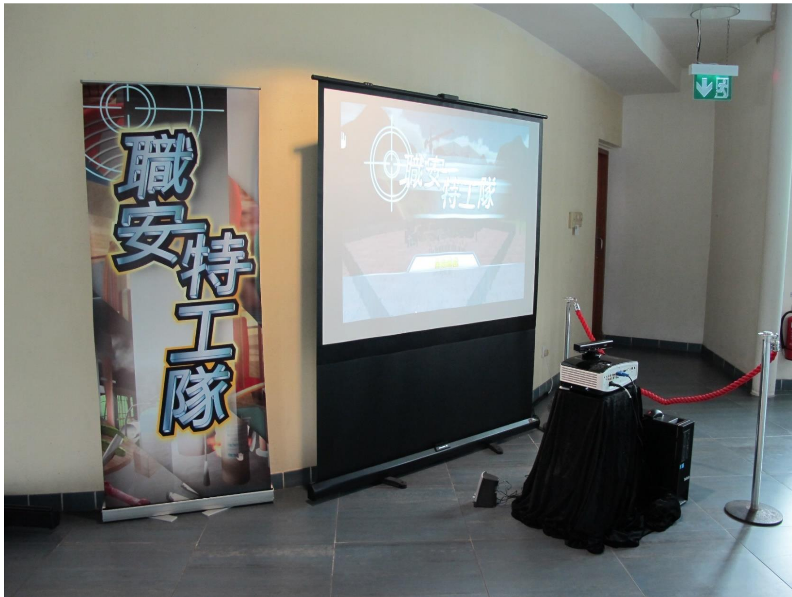
套件現場設置圖(供參考)