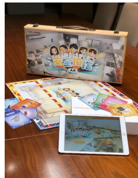
「安全拍檔」和「職安搜查線」AR套件展示圖