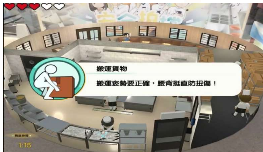
「職安搜查線」AR正確答案顯示