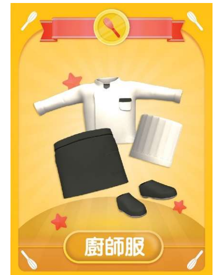
「安全拍擋」配搭圖式樣設計