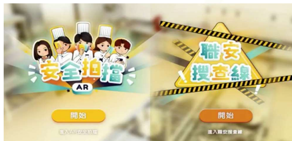
「安全拍擋」和「職安搜查線」AR套件開始畫面